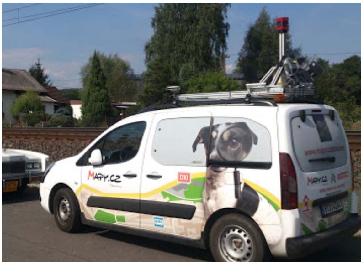
Obrázek 2-6 Kamera LadyBug zakoupená firmou GIS-Stavinex a.s. Ostrava

sférickém režimu (360°). Díky tomu je každý bod zachycen na více snímcích a z různých úhlů. Výrobci těchto kamer jsou firmy FLIR, Sony, Hitachi, Toshiba, IMC, Pelco a další.