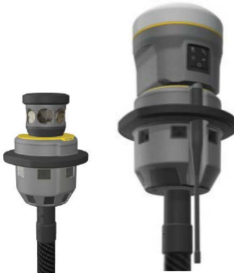
Obrázek 2-8 Trimble V10 vpravo s GNSS přijímačem, vlevo s odrazným hranolem

postará program automatické korelace snímků, kdy automaticky najde identický bod na okolních snímcích a spočítá jeho 3D prostorovou polohu. V případě potřeby toto lze provést přímo v terénu ihned po nasnímání nebo po ukončení měření v kanceláři. Z těchto snímkových skupin lze v příslušném softwaru vygenerovat i hustá 3D mračna bodů metodou Dense Image Mapping (dle algoritmu SGM). Přesnost takto určených bodů je podle vzdálenosti