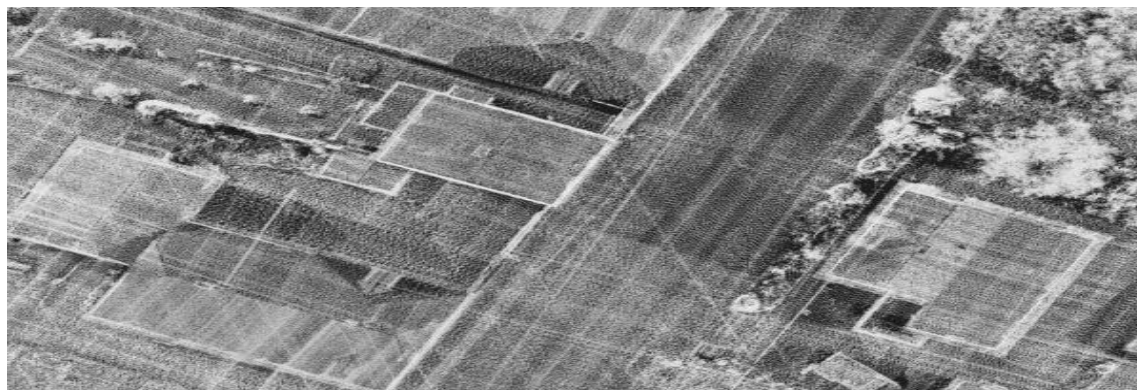
Obrázek 2-5 Ukázky hustého mračna bodů ze skenování dronem k.ú. Dlouhá Lhota

Letecké metody laserového skenování lze vykonávat v současnosti i s dálkově pilotovanými prostředky (UAV) a tyto postupy tvorby dat jsou principiálně shodné s postupy LLS, ale při obvykle pomalejším letu dronu je výsledná hodnota hustoty bodů mračna na metr čtvereční významně vyšší oproti použití skenerů v letounu s osádkou. Vlastní skenery jsou uzpůsobeny provozu UAV především co se týče hmotnosti. Na území ČR byly provedeny rozsáhlé testy k použití dat laserového skenování z dronů ve prospěch mapování katastru. V případě těchto testů byl terén skenován průměrně z výšky 33 m nad terémem při rychlosti dronu (hexakoptéry) 2,3 m/s. V místech překrytu skenovaných linií hustota bodů dosahovala 300 bodů/m 2 , v okrajích jednotlivých pásů klesla na 100 – 120 bodů/m 2 . Při testování nových mapovacích metod pro katastr bylo důležité zaručit jak požadovanou přesnost mapování, tak všechny procedurální kroky při určování hranic mezi vlastníky pozemků. Zjišťování hranic mezi vlastníky pozemků však musí být provedeno při použití této technologie až po odsouhlasení místně příslušným katastrálním pracovištěm neboť v [1] není k použití této technologie zákonná opora. Ukázka mračna bodů pořízeného laserovým skenováním obce Dlouhá Lhota u Sušice je Obrázek 2-5.