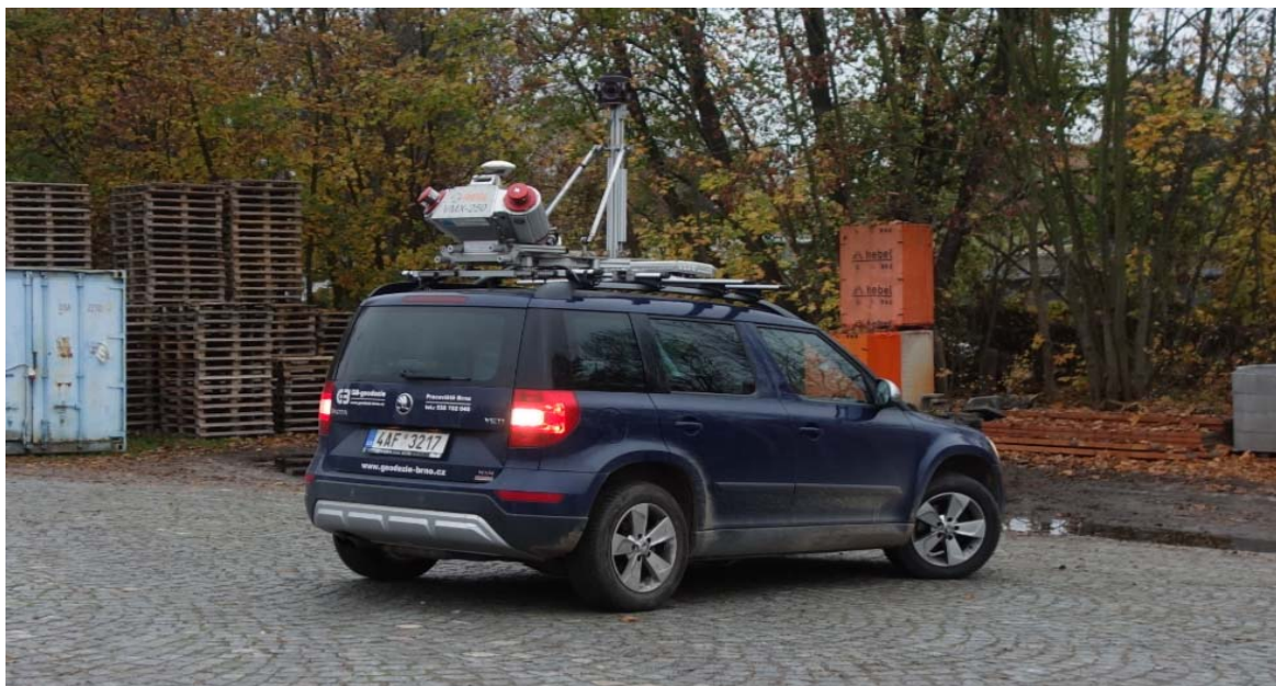
Obrázek 2-2 Aparatura mobilního laserového skenování firmy GB-geodezie, spol. s r.o.

zdroj: https://leicageosystems.com/products/mobile-sensor-platforms/captureplatforms/leica-pegasus-backpack