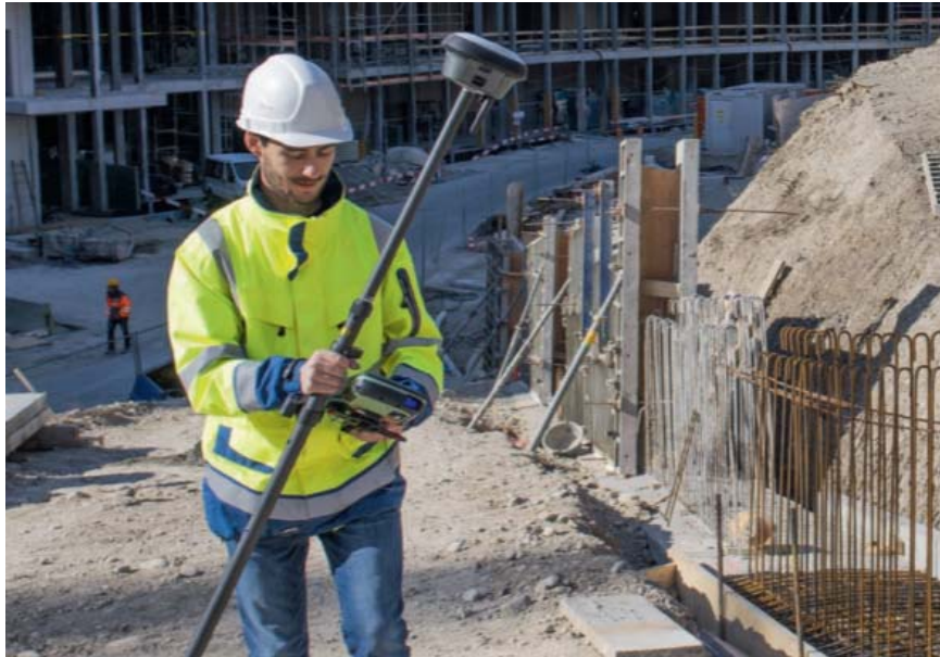
Obrázek 2-9 Zařízení Leica GS18 I

objektů od kamery RMSE_{xyz} = 2 - 4 cm. Využití kombinace metod měření GNSS a průsekové fotogrammetrie nachází především uplatnění při měření těžko přístupných nebo nepřístupných bodů, případně při mapování podrobných bodů v nebezpečných lokalitách, jako jsou např. hluboké příkopy, vysoké strmé svahy, svislé stěny, nedosažitelné prostory například spodní části mostních konstrukcí a dalších prvků železničních staveb. Výhodou této kombinace mapovacích technik je i možnost vrátit se k obsahu snímků a v kanceláři doměřit potřebné mapové objekty bez nutnosti vracet se do lokality. Obrázek 2-9 zobrazuje měřicí systém Leica GS18 I. Přesnost této aparatury studoval ve své diplomové práci Ing. Martin Rokyta v 2021 [11].