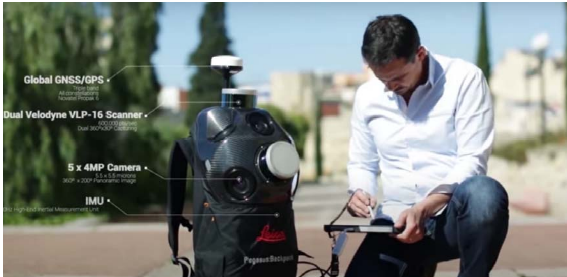
Obrázek 2-1 Aparatura nesená člověkem - Leica Pegasus Backpack,

zdroj: https://leicageosystems.com/products/mobile-sensor-platforms/captureplatforms/leica-pegasus-backpack