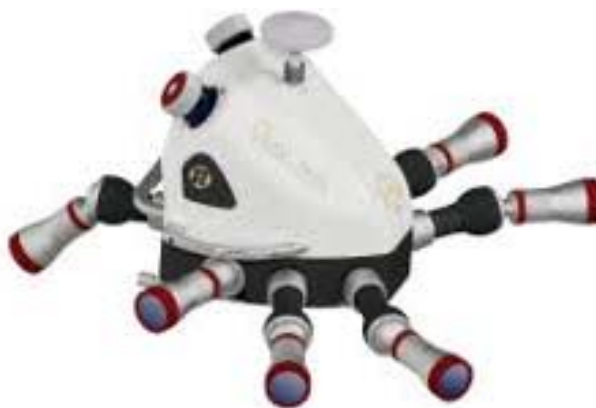
Obrázek 2-7 Laserové skenovací zařízení Riegl s osmi směrovanými kamerami