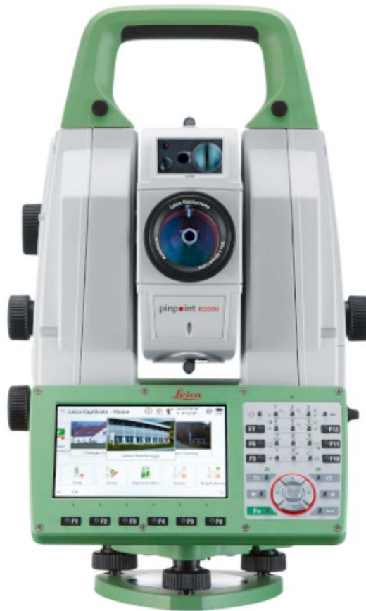
Obrázek 2- 10 Leica MS60

dostupné k 1.2.2021 na https://www.gefos-leica.cz/o-produktech/geodeticke-pristroje/totalni-stanice