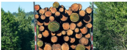
Aktuálně v EUDR